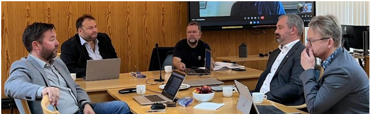
Hardangerrådsmøte i Eidfjord 23.06.222