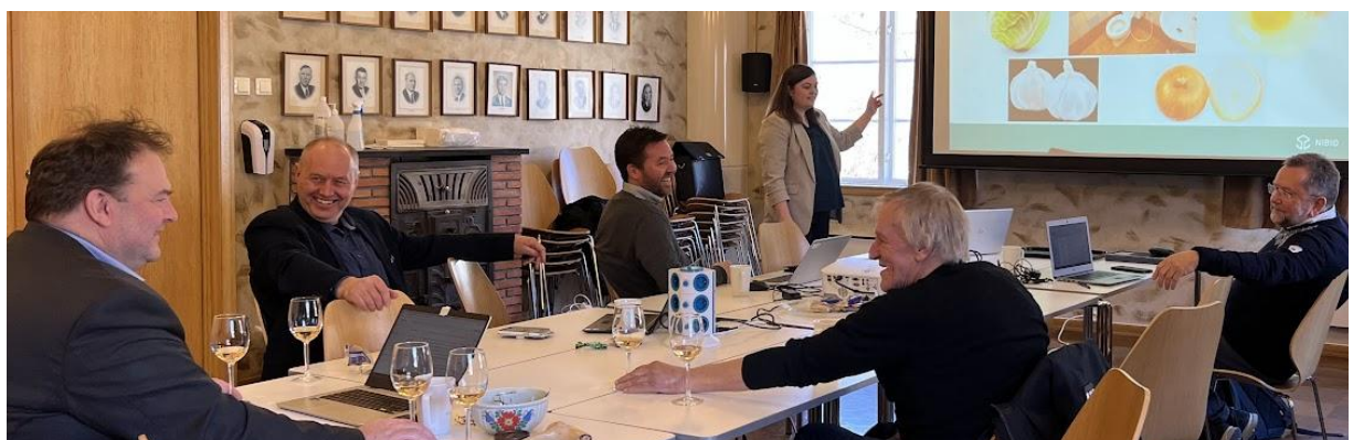
Arsmøte og Hardangerrådsmøte i Ulvik 01.04.22

Hardangerrådet hadde i 2022 6 rådsmøter, dei fleste fysisk og nokre digitale. Planlagt møte med Hordalandsbenken og Sognebenken vart utsett til januar 2023.