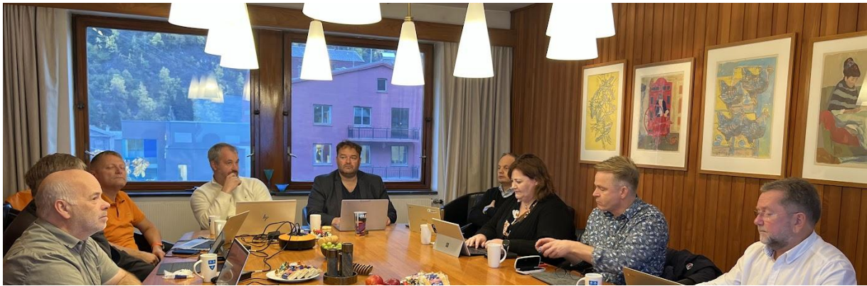
Hardangerrådsmøte i Odda 21.10.22